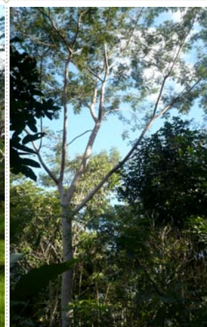
Sengon siap terbang