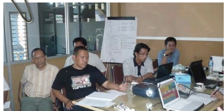
Suasananya diskusi di kantor SCF