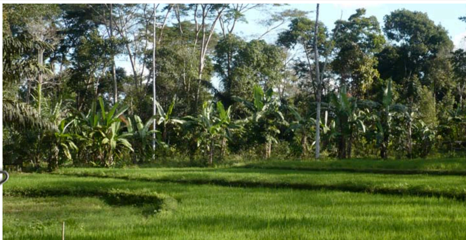
Sawah berpengairan dan hutan campuran sengon dan kebun pisang

Ia juga berujar, bahwa ia dan keluarga beruntung dapat mengelola 3 ha tanah, hidup di atas tanah negara tanpa di pungut biaya. Jadi kita mesti memelihara hutan ini.