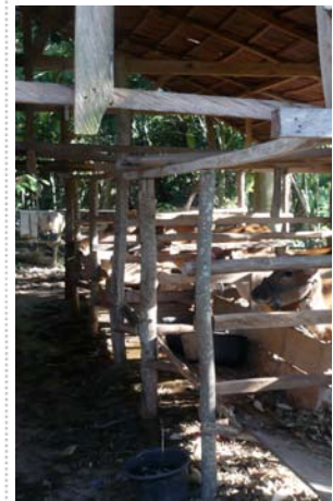
Ternak di aeral HKM

hibah dan pendampingan prgram kali ini lebih jelas dan sangat baik. Ia pun berharap MFP II dapat bekerja lebih baik lagi terutama keterkaitan peran mitra di regional dan pusat atau nasional.