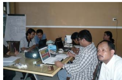
Presentasi Tim MFP II