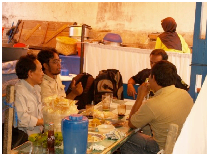
Diskusi program menjadi obrolan di warung makan