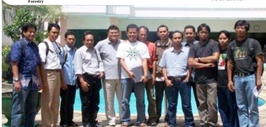
Foto peserta midterm review di Hotel Rocky Padang 12-15 Mei 2009

KEHATI INDONESIAN BIODIVERSITY FOUNDATION